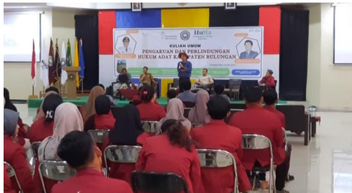
Gambar 1. Penyampaian materi oleh LSM Huma tentang MHA di Kabupaten Bulungan

Sosialisasi masyarakat hukum adat kami lakukan agar ruang jelajah atau kehidupan mereka tidak diganggu. Mengingat ada perusahaan-perusahaan di dalam lingkungan atau ruang jelajah komunitas tersebut, diharapkan komunitas ini tetap bisa hidup di wilayahnya oleh karena itu pemerintah membantu untuk menjaga komunitasnya berdasarkan Peraturan Daerah Kabupaten Bulungan Nomor 12 Tahun 2016 tentang Penyelenggaraan Pengakuan dan Perlindungan Masyarakat Hukum Adat. Kita mengingatkan identitas lokal jangan sampai punah meski kemajuan dan peradaban kian berkembang di Bulungan. Kami ingin merawat dan menjaga kearifan lokal dari suku-suku asli di Kabupaten Bulungan berdasarkan surat keputusan pengakuan dan perlindungan Masyarakat Hukum Adat. (Sumber: https://rakyataltara.prokal.co/read/news/27812-masyarakat-hukum-adat-di-bulungan-perlu-dilestarikan.html )