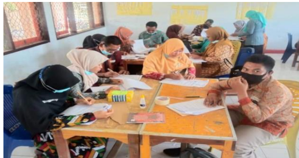
Gambar 5. Kegiatan diskusi kelompok untuk mengerjakan LK