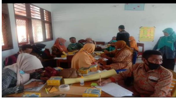
Gambar 4. Kegiatan pembelajaran dan memahami materi dari modul