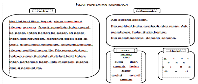
Gambar 2. Materi Kegiatan