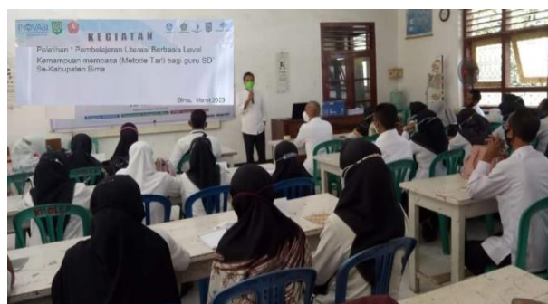
Gambar 3. Penyampaian materi