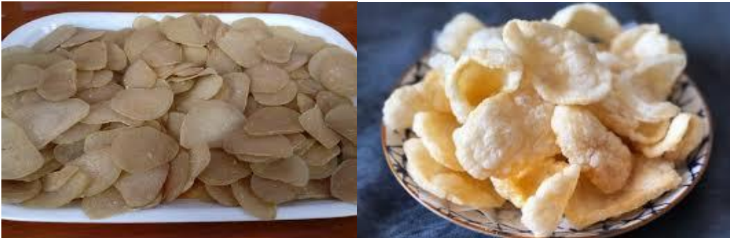
Gambar 7. Hasil kerupuk yang telah di kukus dan di jemur dan digoreng.

Pada gambar 6 adalah kegiatan pembuatan kerupuk ikan bulan bersama warga, dari tahap ini bahan baku yang telah di cooper kita bungkus menggunakan daun pisang untuk di kukus. Pada kegiatan ini di lakukan pendampingan untuk membuat kerupuk ikan bulan dari awal pembuatan sampai setengah jadi.