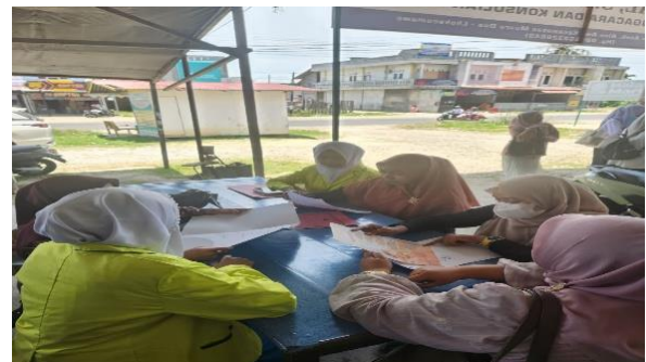
Gambar 2. Aktivitas post test dan pemberian penyuluhan dan praktik pembuatan kerupuk ikan bulan