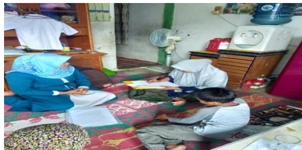
Gambar 1. Aktivitas pengisian kuesioner pengetahuan sebelum edukasi kesehatan tentang jajanan pangan lokal: kerupuk ikan bulan ( pretest )

Peserta yang mengikuti kegiatan ini terdiri dari 26 ibu yaitu ibu-ibu rumah tangga, anggota PKK, dan kader kesehatan di Desa Aluebaroh, Kecamatan Seunuddon, Aceh Utara. Kegiatan pengabdian ini terbagi dalam empat tahap. Tahap pertama adalah Pretest mengenai camilan bergizi lokal seperti kerupuk ikan bulan yang bisa mencegah stunting, yang dilaksanakan pada tanggal 6 Agustus 2025 di Desa Aluebaroh, Kecamatan Seunuddon, Aceh Utara. Tahap kedua meliputi edukasi kesehatan tentang cara membuat kerupuk ikan bulan dan informasi mengenai stunting. Pada tahap ini, peserta diberikan presentasi dengan PowerPoint, menonton video animasi selama 2 menit 35 detik, serta mendapatkan buku berjudul "Buku Ibu Cerdas: Menu Camilan Ikan Bulan Bergizi". Tahap ketiga adalah demonstrasi cara memasak kerupuk ikan bulan, dilanjutkan dengan sesi tanya jawab, presentasi poster, dan pemberian sertifikat. Tahap terakhir yaitu monitoring dan evaluasi dalam jangka waktu 1 minggu setelah kegiatan penyuluhan berlangsung pada tanggal 6 Agustus 2024, yang mencakup ujian pengetahuan kembali (post test) serta pengamatan terhadap perilaku peserta dalam penerapan menu camilan bergizi berbahan pangan lokal, yaitu kerupuk ikan bulan.