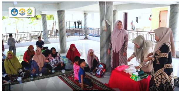
Gambar 4. Penyuluhan tentang kerupuk ikan bulan

Setiap metode memiliki peran penting, seperti video animasi yang memudahkan penyerapan pengetahuan masyarakat pesisir tentang pemanfaatan pangan lokal dalam pembuatan Kerupuk Ikan Bulan. Booklet memberikan informasi secara detail dan jelas, serta membantu memelihara pengetahuan masyarakat tentang cara mengolah menu Snack Kerupuk Ikan Bulan Bergizi dengan bahan utama pangan lokal. Poster memberikan persuasi dan informasi melalui kombinasi bahasa dan gambar yang menarik. Tujuan pendidikan kesehatan adalah untuk meningkatkan pengetahuan masyarakat di bidang kesehatan, mencapai perubahan perilaku, individu, keluarga, dan masyarakat sebagai sasaran utama pendidikan kesehatan dalam membina perilaku sehat dan lingkungan sehat serta berperan aktif dalam upaya peningkatan derajat kesehatan yang optimal sesuai dengan konsep kesehatan sehingga dapat menurunkan angka kesakitan dan kematian (Notoatmodjo, 2018).