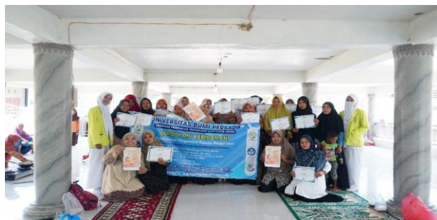
Gambar 5. Foto bersama Peserta sosialisasi pembuatan kerupuk ikan bulan