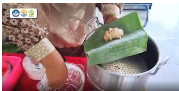
Gambar 6. Proses pembuatan kerupuk ikan bulan