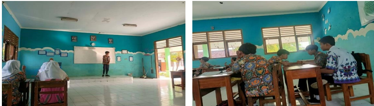
Gambar 2. Siswa SMP Negeri 5 Panji saat mengikuti pembelajaran

Perilaku tersebut menjadi salah satu indikator menurunnya perhatian dan konsentrasi siswa dalam mengikuti pembelajaran di kelas. Aktivitas berbicara dengan teman saat pelajaran berlangsung sering kali menunjukkan adanya gangguan fokus, dan salah satu faktor pemicunya dapat berasal dari kebiasaan bermain game online yang berlebihan. (Kristi, 2025) menjelaskan bahwa game online memiliki elemen kompetitif dan sosial yang kuat, sehingga pemain terbiasa mencari interaksi yang intens dan cepat, dan hal ini dapat terbawa ke dalam situasi belajar sehingga mengurangi kemampuan siswa untuk mempertahankan fokus.