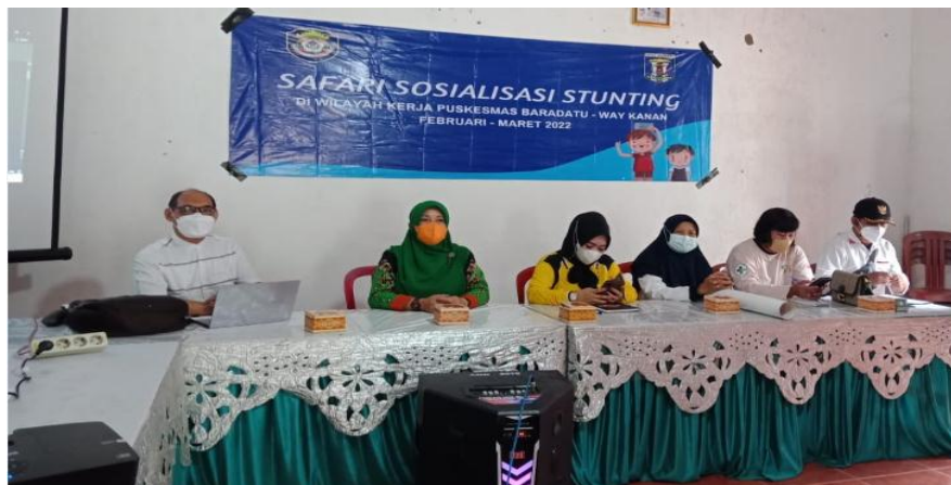
Gambar 2. Nara sumber penyuluhan

Kegiatan penyuluhan dilaksanakan pada tanggal 4 Maret 2022 bertempat di Balai Desa Setia Negara. Kegiatan terlaksana sesuai jadwal dan kehadiran peserta mencapai 100%. Hal ini disebabkan karena sebelum dilaksanakan penyuluhan telah dilakukan persiapan berupa pendekatan informal kepada kader dan perangkat desa berkaitan dengan kesediaan dan penetapan jadwal pelaksanaan kegiatan yang melibatkan peserta. Jumlah peserta yang mengikuti penyuluhan adalah 21 orang yang terdiri dari 15 orang kader, 6 orang perangkat desa. Target kepesertaan penyuluhan dapat dicapai berkat komitmen yang kuat dari Kepala Desa Setia Negara terhadap setiap program desa khususnya program kesehatan dan gizi terbukti dengan kehadiran kepala desa sebagai salah satu peserta penyuluhan secara penuh waktu. Selain itu pihak desa melalui kepala desa juga memfasilitasi semua kebutuhan penyuluhan mulai dari tempat penyuluhan dan perlengkapannya, konsumsi serta transportasi peserta penyuluhan. Demikian juga dalam hal dokumentasi dan publikasi, kegiatan ini diliput oleh media penerbitan lokal.