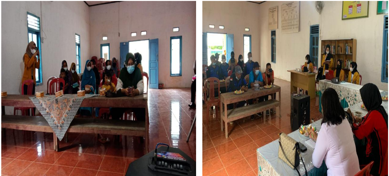
Gambar 2. Peserta penyuluhan

Evaluasi untuk menilai perubahan perilaku kader dan perangkat desa sebagai peserta penyuluhan dilakukan melalui praktik penyusunan RTL. Perangkat desa memperoleh nilai rata-rata yang sangat baik (87,2) dalam menyusun RTL sedangkan kader rata-rata memperoleh nilai baik (76,9). Pengetahuan yang diperoleh dalam kegiatan penyuluhan diduga kuat berkorelasi dengan tingginya nilai RTL yang diperoleh peserta penyuluhan. Menurut Notoatmodjo (2011) edukasi merupakan proses berlangsungnya interaksi antara manusia dan lingkungan dan menghasilkan perubahan-perubahan dalam pengetahuan, ketrampilan serta sikap. Melalui proses edukasi seseorang akan belajar yang awalnya tidak tahu menjadi tahu. Pengetahuan gizi menjadi faktor penting dalam mempengaruhi perilaku gizi individu, keluarga dan masyarakat. Pentingnya pengetahuan terhadap perilaku atau tindakan seseorang juga dibuktikan oleh Yurinta, N. A. (2019), Surjaningsih, dkk. (2014) dan Sari, D. N. (2012).