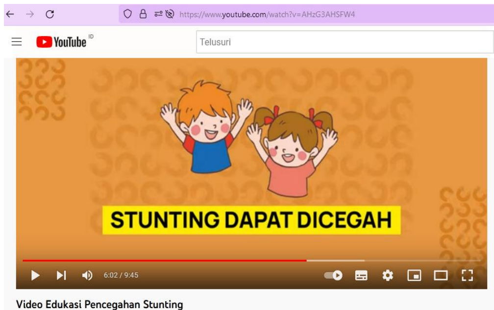
Gambar 3. Video pencegahan stunting https://www.youtube.com/watch?v=AHzG3AHSFW4

Kegiatan penyuluhan yang dilakukan terbukti meningkatkan skor pengetahuan dan sikap peserta. Berdasarkan perhitungan skor pre test dan post test diketahui bahwa skor peserta penyuluhan meningkat rata-rata sebesar 62,4% yaitu dari skor rata-rata 53,3 (pre test) menjadi 84,8 (post test). Terjadinya peningkatan yang signifikan tersebut dimungkinkan karena metode penyampaian materi dilakukan secara interaktif dan partisipatif dengan menggunakan berbagai media audio visual yang menarik, seperti pemutaran video, ceramah, dan simulasi.