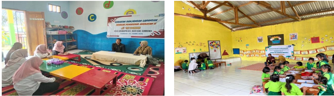
Gambar 5. Kegiatan kunjungan lapangan komunitas belajar TK Tunas Masli

Pelaksanaan Komunitas Belajar dalam sekolah berfokus pada pembelajaran siswa dan guru belajar di dalam komunitas belajar menggunakan siklus inkuiri sebagai acuan mereka untuk belajar secara berkelanjutan dalam upaya peningkatan mutu pendidikan murid di sekolah. Adapun siklus yang digunakan pada panduan ini yaitu refleksi awal, perencanaan, implementasi, dan evaluasi. Sementara itu, melalui Program Kementerian pendidikan dan Kebudayaan (2023) bahwa ada beberapa tahapan dalam membuat komunitas belajar, yaitu (1) Pembentukan tim kecil. Tahapan ini sangat diperlukan sebagai tahapan program strategis prioritas peningkatan kualitas pembelajaran dan hasil belajar siswa. (2) melakukan sosialisasi dan pengimbasan komunitas belajar kepada sekolah sebagai upaya peningkatan kapasitas guru dan penguatan literasi. (3) analisis data kemampuan hasil belajar siswa di satuan pendidikan (sekolah). Kegiatan ini dilakukan untuk memahami rapor pendidikan dan asesmen pembelajaran. (4) Membuat jadwal dan jam belajar komunitas belajar. Implementasinya adalah pembuatan jadwal rutin, peran serta kepala sekolah dalam membuat jadwal, dan efektifitas pertemuan komunitas belajar.