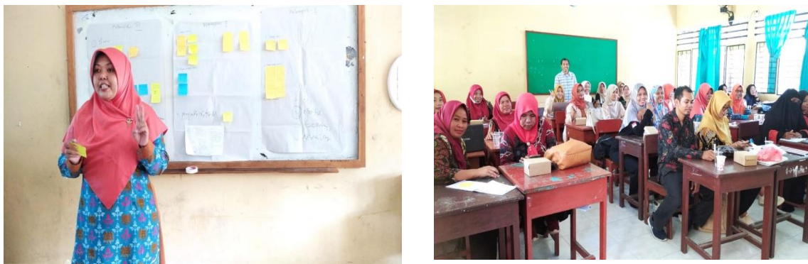
Gambar 4. Kegiatan lokakarya komunitas belajar TK PAUD

Bagan tersebut menjelaskan tahapan kegiatan optimalisasi penggunaan sarana/wadah komunitas belajar sekolah sebagai langkah untuk mewujudkan sekolah yang ramah terhadap anak dan sekolah yang berpusat pada peserta didik. Dalam kegiatan lokakarya, Narasumber juga menekankan tentang penting membuat tiga jenis komber, yaitu; (1) komunitas belajar sekolah, (2) komunitas belajar antar sekolah, dan (3) komunitas belajar berbasis online yang memanfaatkan internet sebagai media belajar dan berbagi praktik baik ( best practice ). Berikut adalah gambaran pelaksanaan lokakarya komunitas belajar sekolah yang melibat guru, kepala sekolah dan pengawas sekolah TK PAUD dari tiga sekolah yaitu TK Doremi, TK Tunas Masli dan TK Jabal Nur.