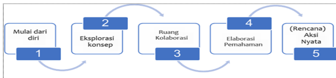
Gambar 1. Alur kegiatan lokakarya

Kegiatan ini melibatkan guru, kepala sekolah, pengawas dan pemangku kepentingan seperti dinas pendidikan terkait. Kegiatan dilaksanakan pada tanggal 21-22 September 2024 di TK PAUD Kabupaten Sumbawa secara moda Luring dengan pola 8 Jam Pelajaran. Kegiatan dilaksanakan selama 2 (dua) hari dengan alur dan rangkaian kegiatan sebagai berikut yaitu;