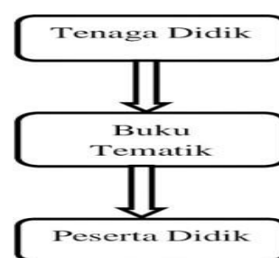
Gambar 2. Pola Pembelajaran IPA Kelas Tinggi di SDN 2 Panggung sesuai dengan Barry Morris (2015).

Setelah peneliti melakukan pengamatan selama 1 bulan di bulan agustus di kelas 4,5 dan 6 peneliti mengamati bahwa guru menerapkan polanpembelajaran yang sama, yaitu pola pembelajaran tradisional 2. Pola pembelajaran ini terus di terapkan dalam 1 bulan. Selama 1 bulan peneliti hanya melihat guru mengajar dengan cara menjelaskan materi, menuliskannya ke papan tulis dan memberikan tugas belajar di rumah.