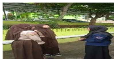
Gambar 3. Kegiatan Wawancara dengan siswi pondok (IX C )

Gambar 2 memperlihatkan momen ketika guru menggunakan kosakata Arab sebagai aba-aba lari. Instruksi ini membantu siswa mengasosiasikan bahasa Arab dengan tindakan jasmani, sehingga pemerolehan kosakata terjadi secara kontekstual. Dokumentasi ini menguatkan temuan bahwa pembelajaran berbasis aktivitas fisik dapat menjadi sarana internalisasi bahasa.