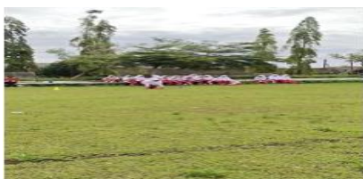
Gambar 1. Pelaksanaan integrasi bahasa arab dalam pembelajaran PJOK

Berikut dokumentasi pelaksanaan integrasi bahasa Arab dalam kegiatan PJOK.