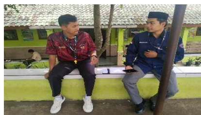
Gambar 4. Kegiatan wawancara dengan guru PJOK

Gambar 3 mendokumentasikan proses wawancara dengan siswi pondok. Informasi yang diperoleh mengungkap bahwa siswa pondok terbiasa dengan lingkungan berbahasa Arab merespons instruksi dalam PJOK dengan lebih cepat dan antusias dibandingkan siswa non-pondok karena pembiasaan senam pagi setiap hari Minggu. Data ini menguatkan adanya perbedaan pengalaman linguistik siswa yang memengaruhi penerimaan mereka terhadap penggunaan bahasa Arab di kelas PJOK.