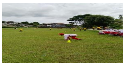
Gambar 2. Praktik integrasi bahasa arab saat instruksi lari

Gambar 1 menunjukkan proses pembelajaran PJOK ketika guru memberikan instruksi menggunakan bahasa Arab pada kegiatan pemanasan. Siswa mengikuti gerakan yang diarahkan sambil mendengarkan hitungan Arab yang diucapkan guru. Situasi ini menunjukkan bahwa penggunaan bahasa Arab berlangsung secara alami di tengah aktivitas fisik dan menjadi bagian dari rutinitas pembelajaran.