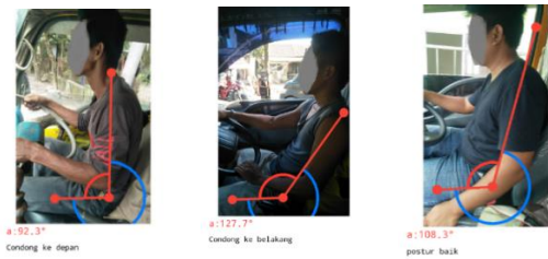
Gambar 2. Postur Mengemudi